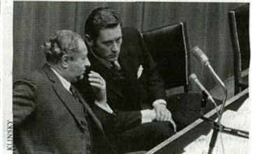
Kreisky mit Finanzminister Androsch 1974 auf der Regierungsbank, Karl Blecha am Rednerpult des Nationalrats