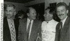
Hegemonie der SPÖ: Blecha mit Krankl, Schranz, Prohaska

17. 4. 2008, ORF 2, 22.50 Uhr „Hannes Androsch. Ein politisches Portrait“. Wiederholung: 18. 4. 2008, ORF 2, 12 Uhr