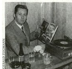
Wilde Siebziger: Man beachte Fernseh-Gerät und Plattenspieler