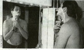
Nackte Oberkörper gab es schon vor Jörg Haider